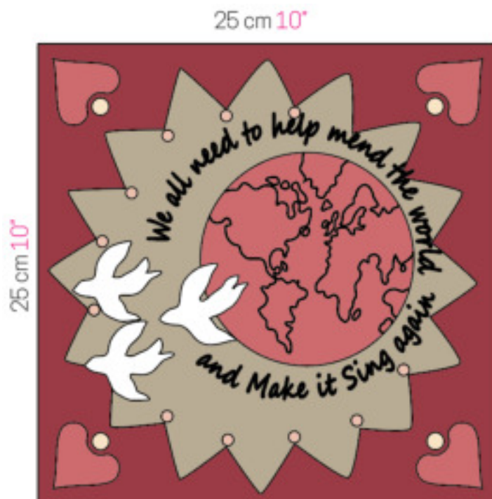
Schéma 2 : Reportez le contour de la pièce « 2 » sur le carré A rouge à carreaux. Evidez et réalisez un appliqué inversé, toujours à petits points glissés, sur le carré de fond A. Coupez le surplus de tissu à l'arrière. Ajoutez les autres appliqués ainsi que les broderies du texte. Recoupez le bloc appliqué à 26.5 x 26.5 cm ( 10\frac{1}{2} " x 10\frac{1}{2} " ), marges de couture comprises.

* Marges de couture comprises * Seam allowances included