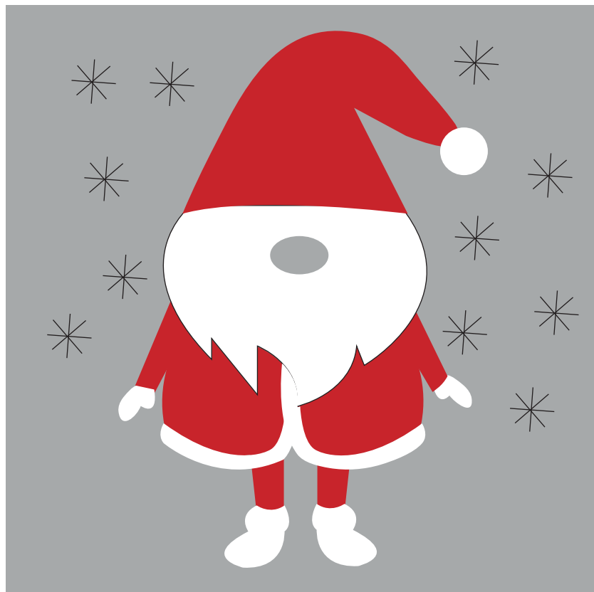
Gabarit à taille réelle Full size template