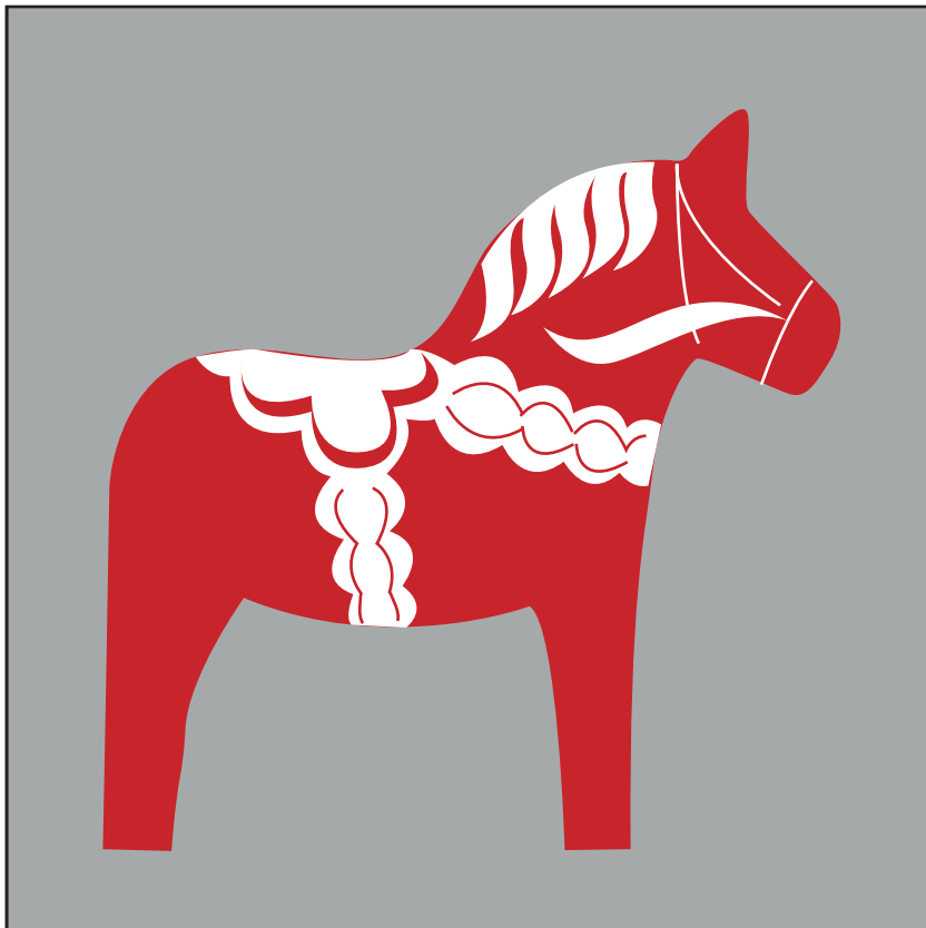
Gabarit à taille réelle Full size template