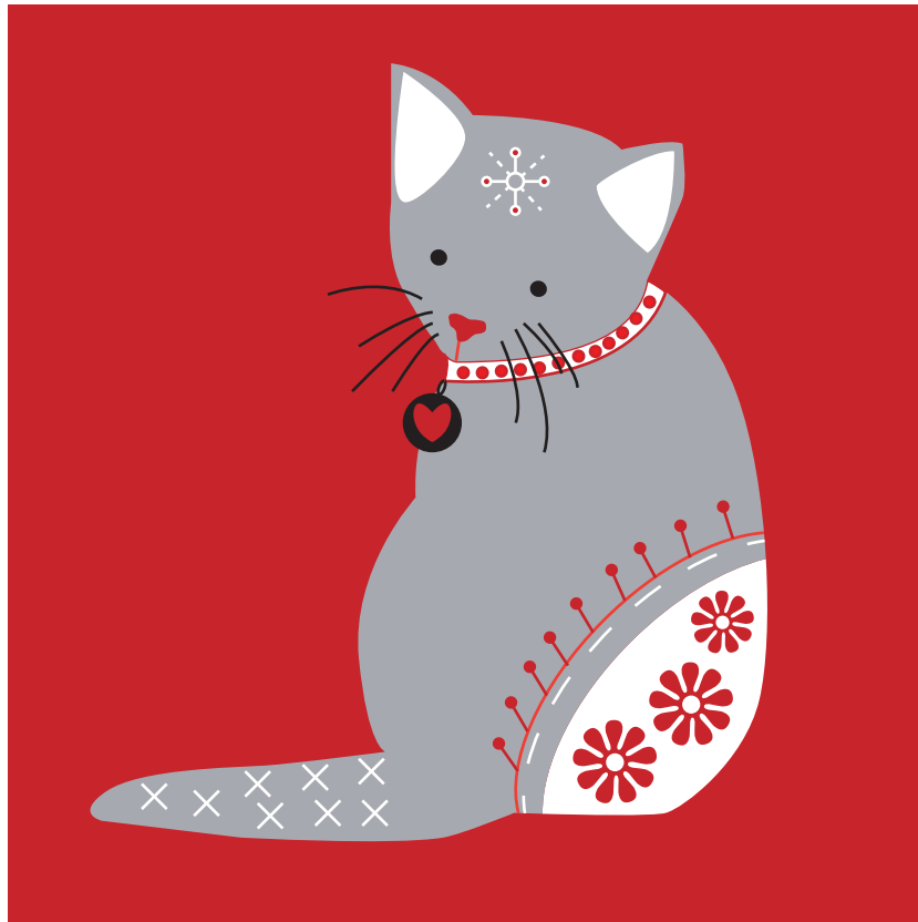
Gabarit à taille réelle Full size template