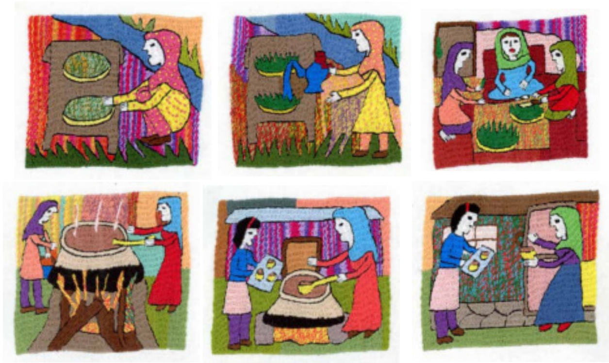
Samanak-préparation pas à pas – brodé de Meshgan

Ramadan ou encore Ramazan, comme l'appelle les Afghans, a commencé. Les brodeuses seront moins actives pendant ce temps particulier, synonyme de moins d'énergie pendant les journées. Mais il est sûr, d'ici le prochain voyage en juillet, qu'elles auront encore produit de superbes broderies qui nous raviront par leurs couleurs et leurs idées.