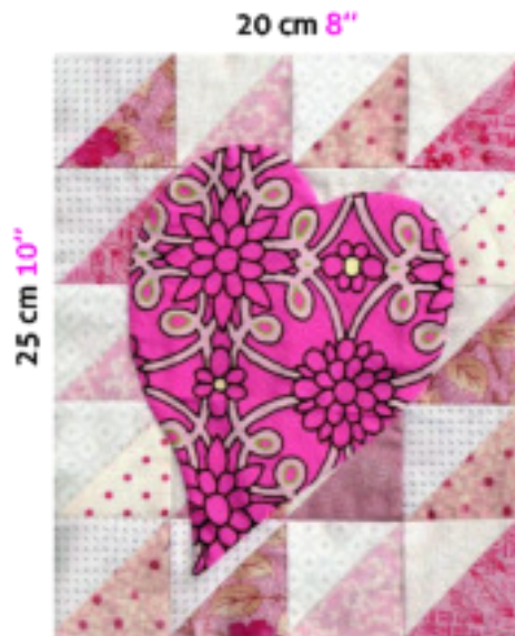
Marges de couture non comprises Seam allowances not included schéma 3

Votre bloc 4 est terminé et mesure 21.5 x 26.5 cm (8 ½" x 10 ½") marges de couture comprises. Nos copines du groupe du mardi l'ont préparé en pensant fort à vous !